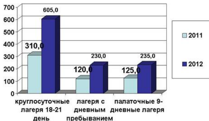
Размеры средств государственного социального страхования на удешевление стоимости путевки в лагерях различных типов (тыс. рублей)

Средняя расчетная стоимость путевки в лагерь с круглосуточным пребыванием в летний период 2012 года составит 1,8 млн. руб. (в 2011 году - 834,4 тыс. руб.), т.е. увеличится более чем в два раза. При этом удельный вес дотации государственного социального страхования в стоимости путевки составит около 34%. В тоже время спрос на путевки в загородные лагеря остается высоким, а в ряд лагерей их попросту уже нет возможности приобрести.